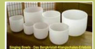
Singing Dows - Das Bergkristall-Klangschalen-Erlebnis

Klangtherapeut Tel. +41 41 783 10 25 Mobile +41 79 350 39 35 info@kristallklang.ch kristallklang.ch